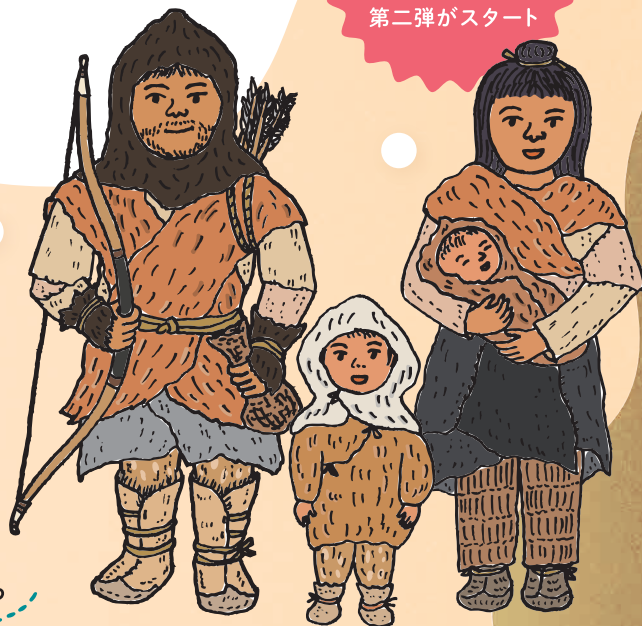
イラスト スソアキコ